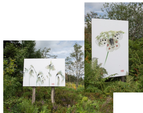
« Les sentiers de la photo ».

Quelle fierté de compter parmi les adhérents de notre Association, cet amoureux de la nature et de la lumière, cet artiste discret, ce promeneur rêveur ... Nous lui adressons tous nos vœux de réussite pour la poursuite de cette très belle aventure professionnelle et lui souhaitons très sincèrement tout le succès qu'il mérite notamment pour son exposition à ciel ouvert qui se déroule jusqu'au 30 octobre prochain au Haut du Tôt dans les Vosges C'est donc au détour d'un chemin creux ou à l'ombre des hauts sapins que vous pourrez découvrir ses œuvres.